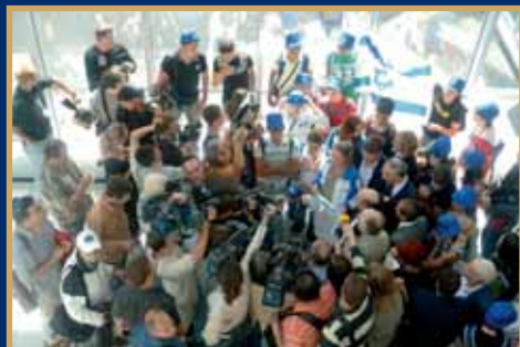
A médiaágazati vizsgálat eredményei