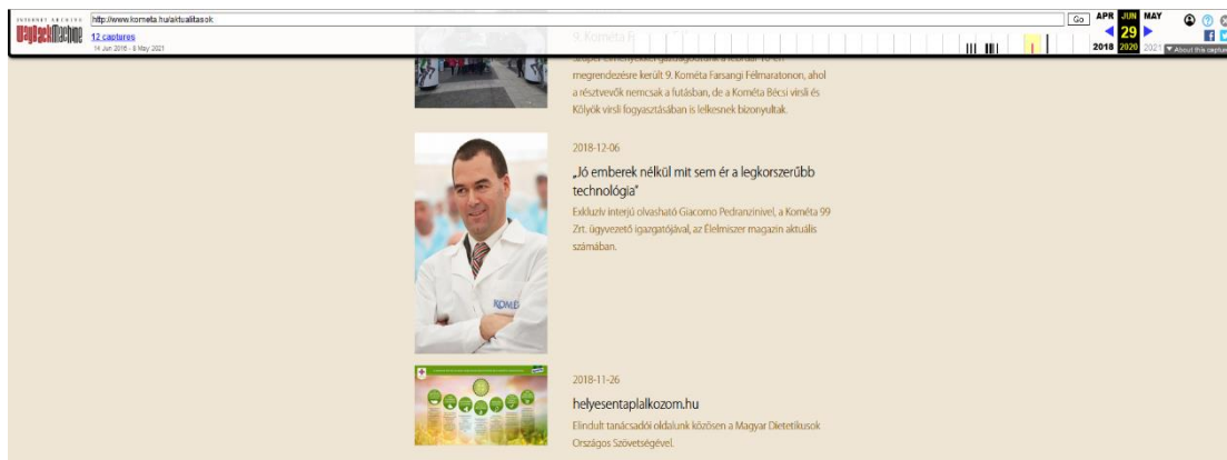
2. ábra: A KOMETA honlapjáról a web.archive.org szolgáltatással készült mentés