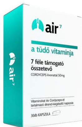
AIR7 – A tüdő vitaminja