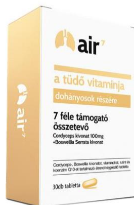
AIR7 – A tüdő vitaminja – dohányosok részére